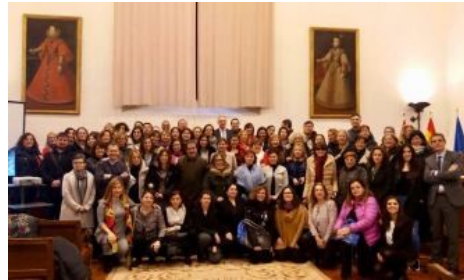
Europe Direct, la UE más cercana

Cualquier ciudadano o ciudadana de la Unión Europea puede ponerse en contacto con las instituciones europeas a través de diferentes medios, como nuestras redes sociales o el teléfono gratuito 00 800 6789 10 11.